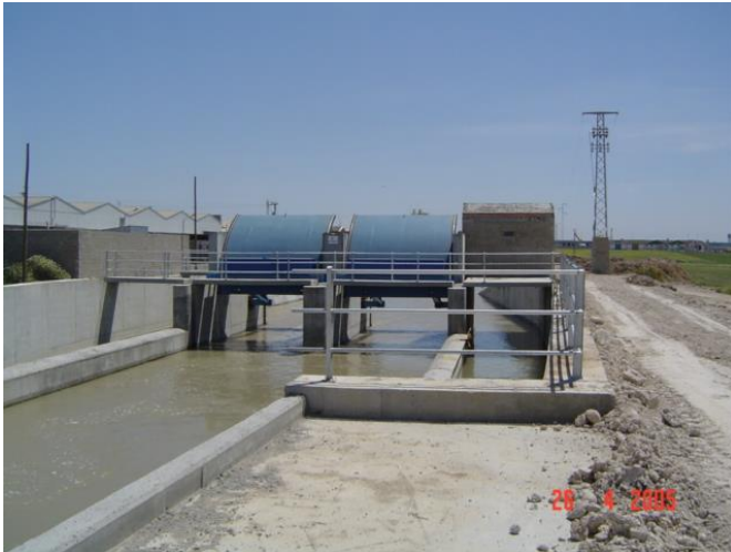
Montaje de compuertas Taintor en Torreblanca (Sevilla)

Las compuertas Taintor empleadas en los aliviaderos permiten elevar la cota del agua embalsada y realizar grandes evacuaciones o regular dicha cota. En el caso de tomas, las compuertas Taintor son principalmente un elemento regulador. Las compuertas Taintor empleadas en canales abiertos se suelen emplear como elemento regulador para aportar un caudal determinado de agua o para mantener, aguas arriba o aguas abajo, una determinada cota en el canal.